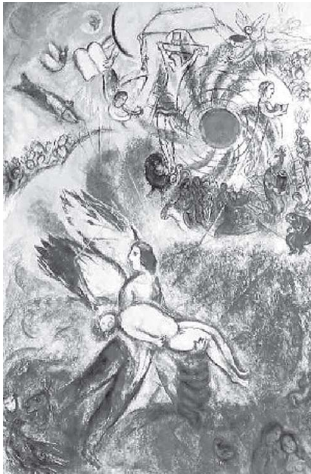
Сотворение мира. М. Шагал