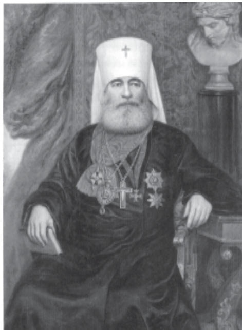
Митрополит Санкт-Петербургский и Ладужский Антоний (Вадковский)

В этом году исполняется 100 лет изданию указа "Об укреплении веротерпимости".