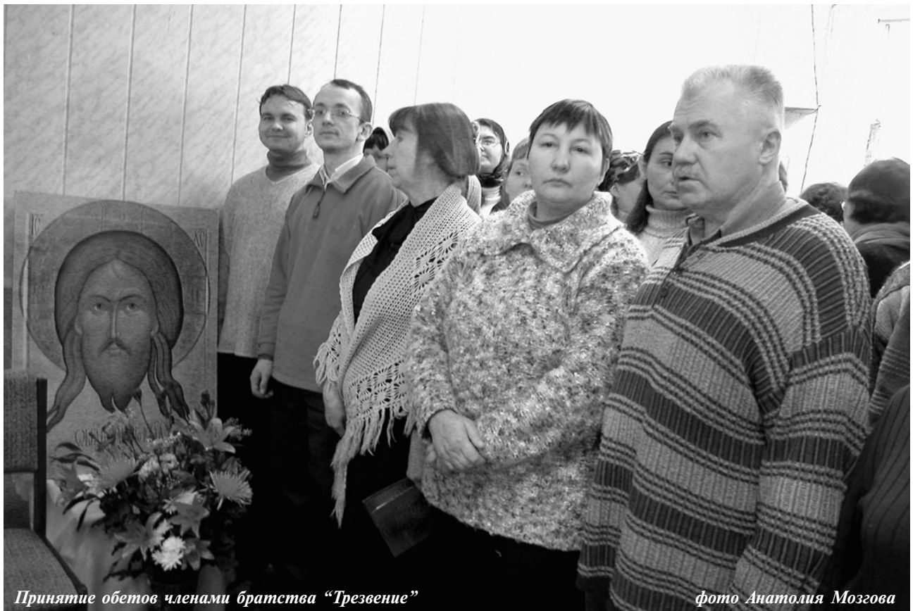
Принятие обетов членами братства “Трезвение”