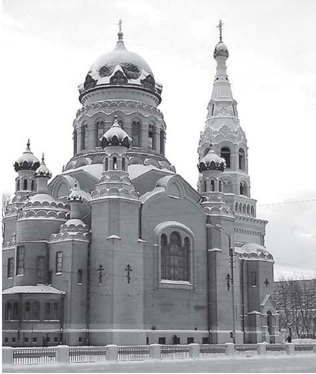
Храм Воскресения Христова в Санкт-Петербурге