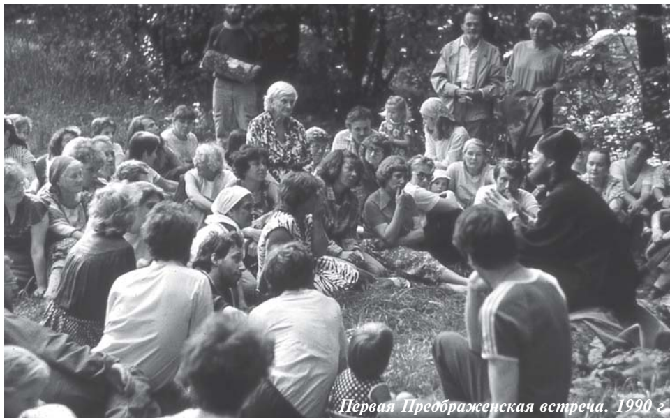
Первая Преображенская встреча. 1990 г.

В некоторых из этих городов позже возникли братства, где-то же прекратилось какое бы то ни было движение к общинно-братской жизни.