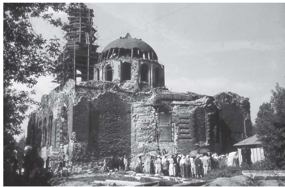
Литургия у разрушенного храма в г. Электроугли. 1990 г.

Самая первая фраза, которую он сказал, выйдя на сцену актового зала, историкам, читавшим себя в университете элитой, знающей все, и студентам романо-германской филологии (которые были причастны к языкам, а в Советском Союзе это был хоть какой-то шанс быть причастным к западной литературе) — «Я утверждаю, что вы ничего не знаете о христианстве». В зале сначала разразилась просто буря — эмоциональная, которая каким-то образом озву-