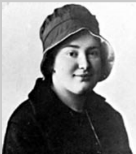
Е.Ю. Кузьмина-Караваева. Начало 1910-х гг

В этом году исполнилось 60 лет со дня гибели в концлагере Равенсбрюк преподобномученицы Марии (Скобцовой). Дата эта прошла почти незаметно — может быть, потому, что она ставит нас перед необходимостью понять, что значит опыт матери Марии в нашей сегодняшней жизни.