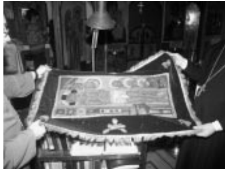
Планица, вышитая матерью Марией