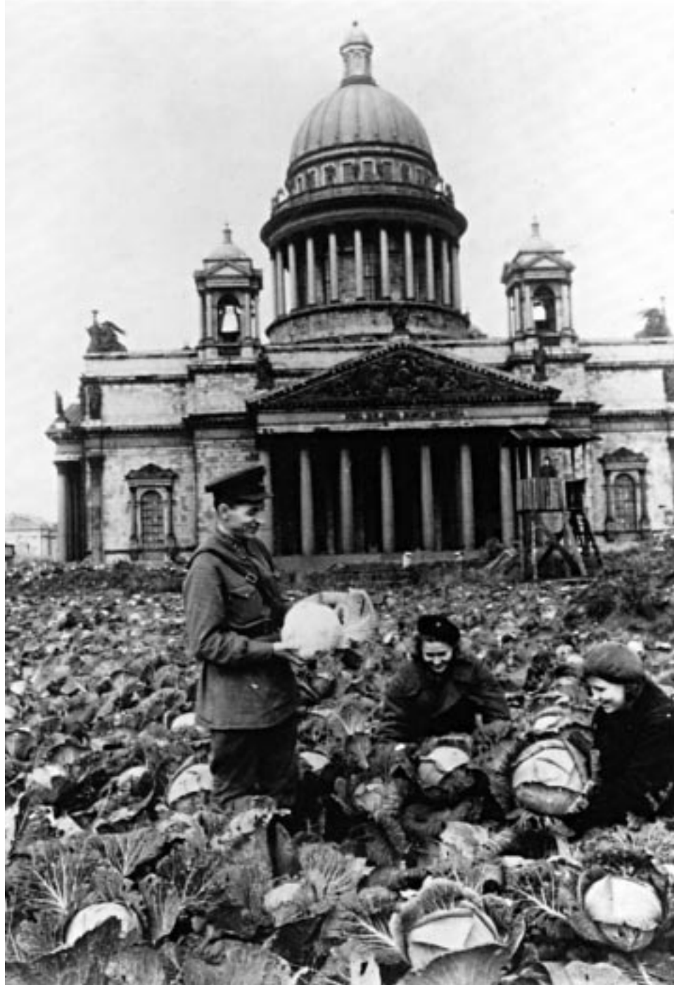
Блокадный Ленинград. Жители города собирают урожай капусты с огородов у стен Исакиевского собора.

Запись рассказов, расшифровка и литературная обработка Михаила ШВИРИНА