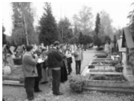
Молитва у могилы о. Сергия Булгакова на кладбище Сен-Женевьев-Дю-Буа