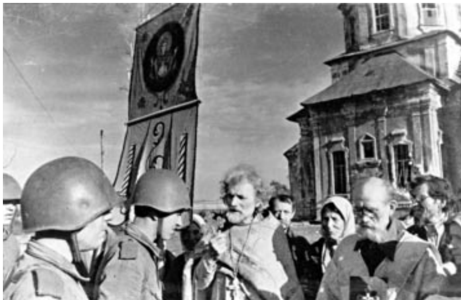
После битвы под Курском. Жители города Дмитровска-Орловского встречают красноармейцев, освободивших город. 1943 г.

Вот так часовня недели две пустая стояла: и была готова для службы, но входить в нее боялись. И тут наш «святой» надел черную шапочку, крест и пошел в часовню на рассвете, как он говорил, «вспомнить утреню». А мы все ждали, что стрелнут финны и кажут ему. Но финны не стреляли. А потом к нему присоединились уже и некоторые пожилые верующие. Человек пятнадцать набралось. Почти все лето, как можно было, ходили они на службу. А тем временем настала осень и лист с деревьев совсем облетел. Наш «островок» стал просматриваться с финской стороны и опять засвистели пули. И опять мы ждали, что вот-вот убуят нашего «святого» и делов. Но вот что удивительно. В то время, как «святой» был в часовне, огонь с финской стороны вдруг сразу прекра-