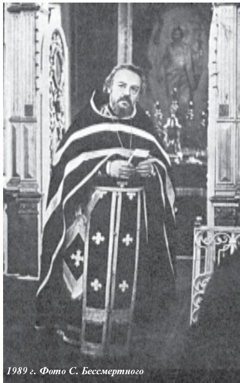
1989 г.

А.М. Копировский: Нет. Мне было интересно читать «Истоки религии», но не могу сказать, что эти книги меня захватили или помогли сформировать отношение к вере. «Сын Человеческий» тоже был прочитан без серьезных последствий, наверное, потому, что уже было прочитано много другого, и