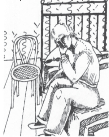
Мать Мария (Скобцова). Рисунок в книге «Стихи». Бумага, тушь, 1937 г.

«Иную жизнь почувствовать свою, Её восторг и бодь и свету».