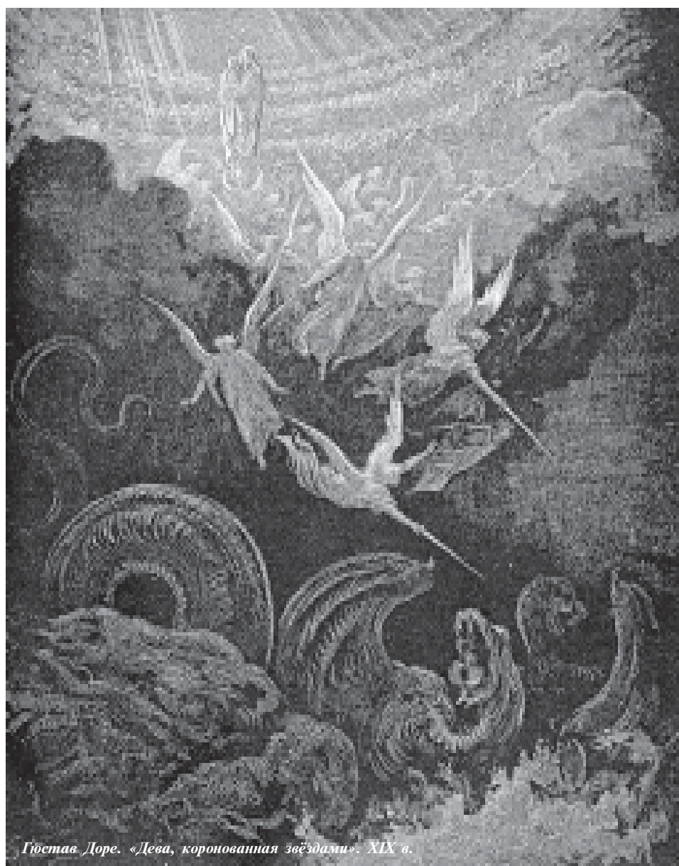
Гюстав Доре. «Дева, коронованная звездами». XIX в.

Я думаю, что этому надо уделять больше внимания, когда мы говорим о