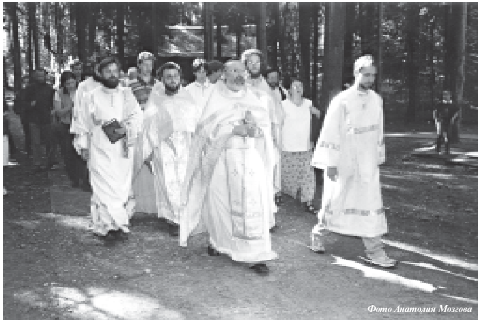
Крестный ход участников встречи

С 19 по 21 августа в Подмоскowie прошла традиционная встреча Преображенского содружества