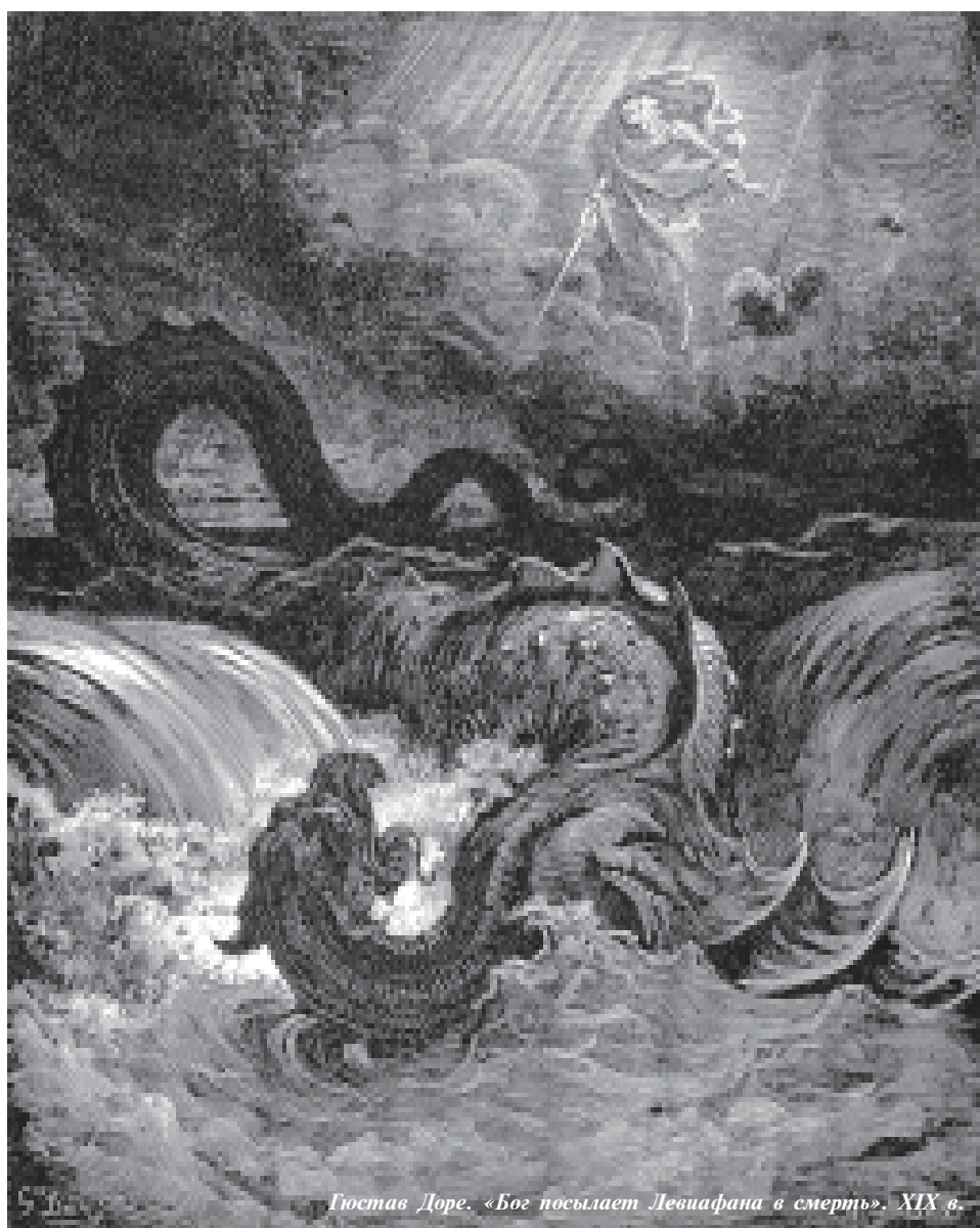
Густав Доре. «Бог посылает Левиафана в смерть». XIX в.

Она уже давно дана в Христовом Откровении, но подтверждена ли она реально сейчас? Почему так мало взоров обращается в сторону христианства? Почему этой альтернативы не видно? Почему очень часто мы напоминаем не столько христолюбивое воинство, сколько неудачливых потребителей? Ну, не совсем же случайно ходит молва о христианах, что они люди, которые просто не умеют приспособиться к реалиям мира сего, — жить не умеют! И поэтому, когда мы говорим о харизме возрождения полноты церковности, мы говорим не о чем ином, как о возрождении действительной альтернативы, той подлинной жизни, которая содержит в себе реальную возможность не допустить внутрь своей жизни то, чем так откровенно болен сейчас мир, окружающий нас. Братство как возрождающаяся церковь — это действительно альтернативный мир, именно мир, на который можно смотреть, в который можно входить, в котором можно жить, который можно культивировать, который может шириться, вбирать в себя новых спасающихся. Очень давно мы не видим в том, что называется спасением, поиска иной жизни. Едва ли не чаще всего о спасении говорят как о поиске иной смерти, вернее, иной по-смертной судьбы. И говоря о поисках полноты церковной жизни мы говорим на самом деле о подлинном восстановлении в правах того, что мы называем спасением.