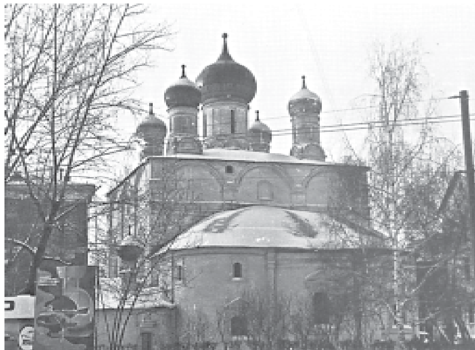
Владимирский собор Сретенского монастыря, нач. 1990-х гг.