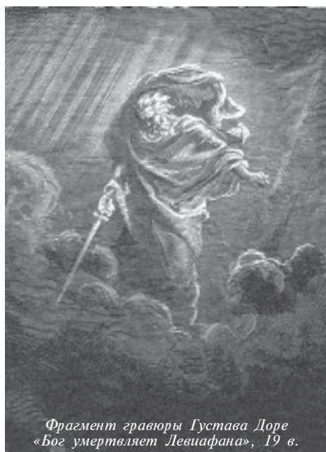
Фрагмент гравюры Густава Доре «Бог умертвляет Левиафана», 19 в.

«Положение» не поставило ни церковной, ни правовой задачи епархиального судопроизводства. Поэтому обратимся к той «эмпирической жизни», из которой «церковное сознание заимствовало принцип права», и посмотрим,