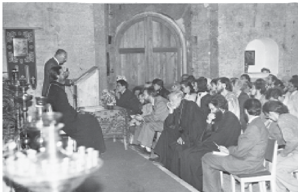
Афанасьевские чтения, 1993 г.