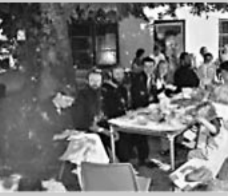
На расширенной встрече административного совета Синдесмоса. На первом плане — епископ Силуан и Зоя Дашевская