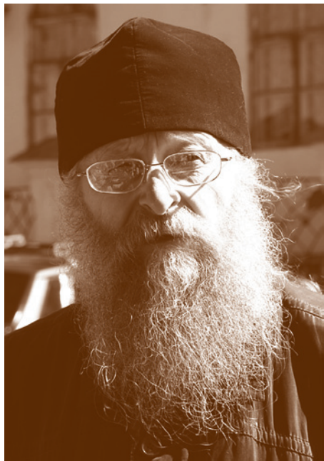
Начало на с. 1

Какие надежды Вы испытываете в связи с наступившим годом? У многих этот год столетия революции вызывает тяжёлые ассоциации.