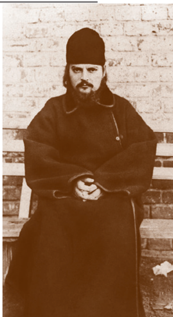
Отец Сергий Мечёв (17 сентября 1892 г. – 6 января 1942 г.)