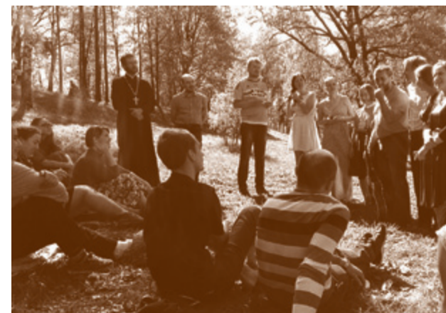
Симпозиум проходил в живописном парке Павловска