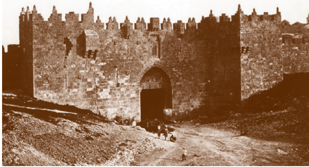
Стены Иерусалима. Фотография XIX века

интересовала строгая научная обоснованность местоположения святыни. Он вполне искренне говорит, что на Елеонской горе он видел «след ноги Вознесшегося, чудесно вдавленный в твердом камне, как бы в мягком воске, так что видна малейшая выпуклость и впадина необыкновенно правильной пяти» 26 . Отец Порфирий, помимо этого следа видел отпечатки ступней Христа близ Назарета, в том месте, где иудеи хотели сбросить Иисуса с утеса 27 .