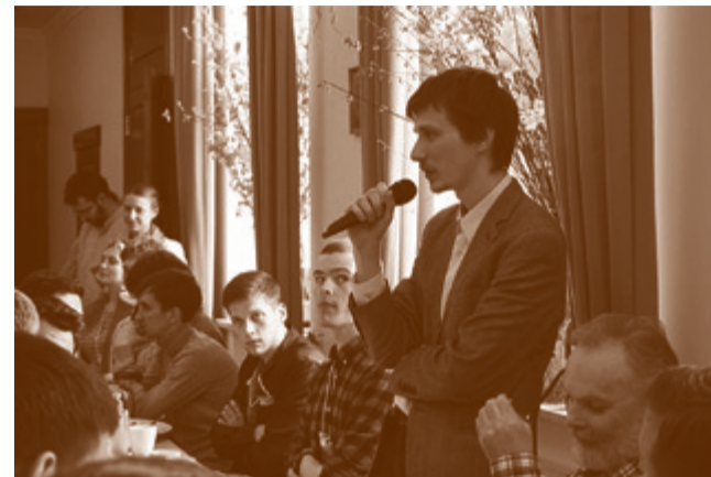
Обсудить свои проблемы с духовным попечителем братства участники фестиваля могли не только на встречах, но и во время совместных трапез

Развитие тем, затронутых на фестивале, должно про-