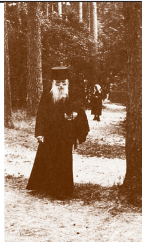
Архимандрит Таврион (Батозский)

У батюшки была такая свобода духа, она настолько укрепляла, что и я рядом с ним героем себя чувствовала. Он многое испытал, и ему нечего было бояться. Батюшка говорил, что ему в карцере порой было легче, чем в Пустыньке. Сами представляете, если он знал всех людей,