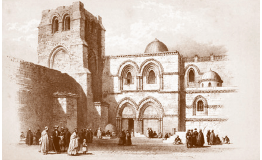
Фасад храма Гроба Господня. Гравюра Джорджа Вильямса, 1849 г.

Думается, все-таки, Константин Степанович неправ. И путешествие Николая Васильевича дало плоды.