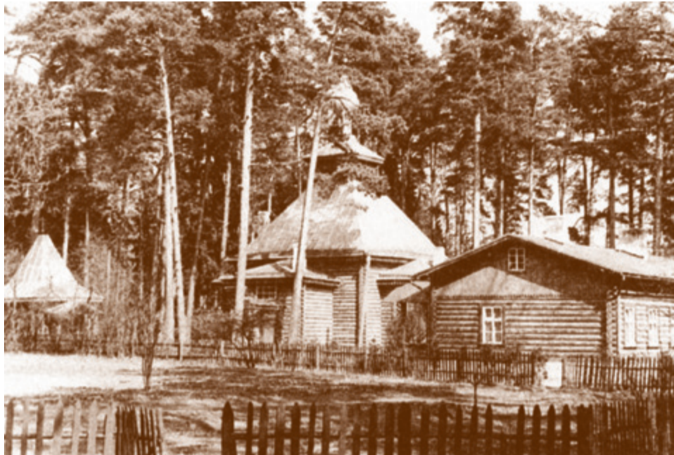
Спасо-Преображенская пустынька под Елгавой

Ведь сейчас бояться его святости, даже на могилу его бояться ходить. И я бы боялась. А так я живу одна – не в монастыре – ни от кого не завишу и могу о его святости свидетельствовать.