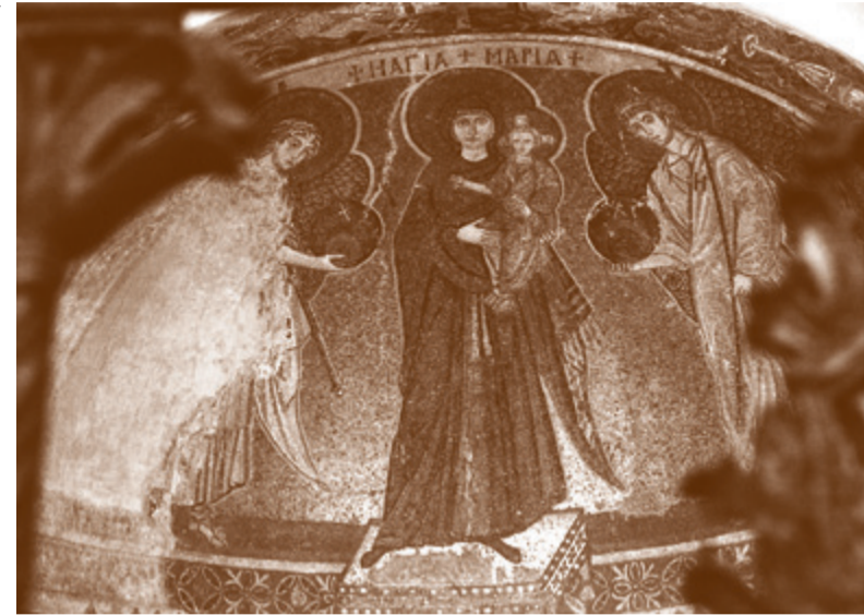
Мозаика в апсиде храма Панагии Ангелоктисти. VI век