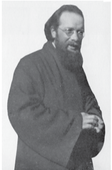
Отец Димитрий Клепинин (1904–1944)

«Те, кто в жизни своей вели себя свято и набожно и жизнь свою через труд и слово посвящали служению в любви к Богу и ближнему, о ком после их преставления знаками и чудесами засвидетельствовал Бог, тем святая Церковь Христова умеет на все времена и со всяким бла-