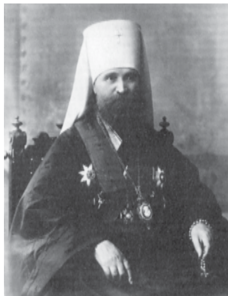
Первый архиерей-новомученик, митрополит Владимир (Богоявленский), фото 1913 г.

Начало разрушения канонической границы мы можем увидеть на одном из многих примеров, который может быть, наиболее значим для последующей истории России, - примера с рабочим классом. Здесь будет уместно напомнить, что высказывание о высокой религиозности русского народа предреволюционной поры всегда стоит понимать в контексте разговора о традиционной, патриархальной религиозности православных людей с устоявшимся, расставленным "годовым кругом" и неизбежным акцентом на об-