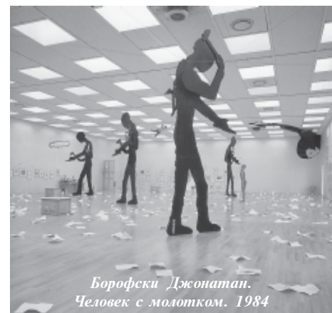
Борофски Джонатан. Человек с молотком. 1984

Тот человек, о котором Вы нам написали (без упоминания его имени) - действительно является пастором, но не является представителем нашего Института, а лишь одним из его студентов-заочников. Он был членом Русской православной церкви и, в связи с конфликтом, был вынужден из нее уйти как раз в РПЦЗ. Уехав затем в Швейцарию, он оказался, велем судеб, формально про-