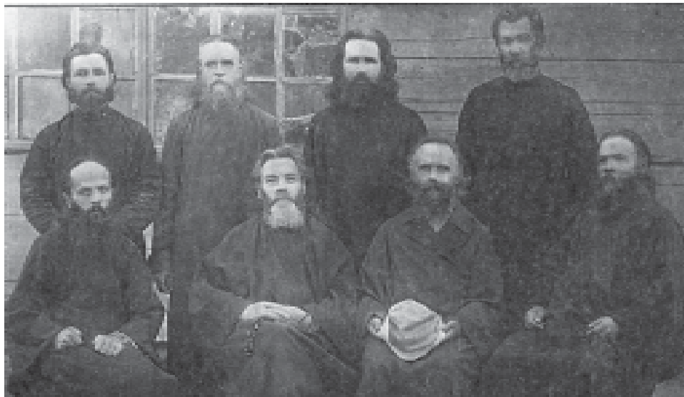
Митрополит Арсений (Стадницкий) (сидит, второй слева) в кругу православных иерархов и клириков в среднеазиатской ссылке. Фото 1927 г.