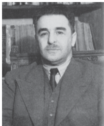
Илья Исидорович Фондаминский (1880–1942)