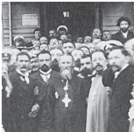
Отец Иоанн Кронштадтский в гостях у одного из столичных братств. Санкт-Петербург, начало XX века.

Наверное, мы здесь не найдем более яркого примера узнавания времен и стро-