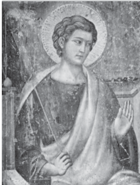
Апостол с фрески Каваллини «Страшный суд». Ок. 1293.

Братство может состоять из трех категорий лиц: