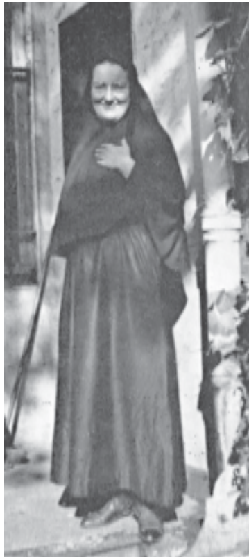
Мать Мария (Скобцова) (1881–1945)

Прот. Сергей Гаккель: Я надеюсь, что это будет так. Эту канонизацию производит Вселенский патриархат. Нужно сказать, что материал был под-