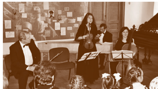
Ансамбль «Новая Голландия»