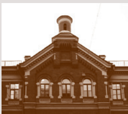
Церковь Марии Магдалины при Училище лекарских помощниц

при Училище лекарских помощниц – явилось своеобразной реакцией на усиливающуюся разобщённость русского общества и ослабление напряжения христианской жизни. До появления о. Иоанна братство