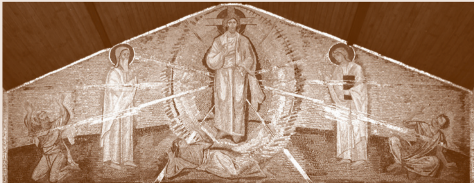
Преображение Господне. Мозаика в часовне загородного дома КПЦ «Преображение»

Из проповеди священника Георгия Кочеткова на Утрене в день открытия конференции «Длительная катехизация сегодня»