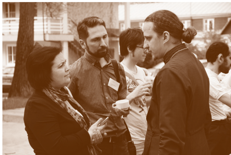
Во время многочисленных перерывов разговор можно было продолжить

В обзоре использованы репортажи Софии Андросенко, Дарьи Макеевой и Анастасии Наконечной, опубликованные на сайтах Свято-Филаретовского института и Преображенского братства