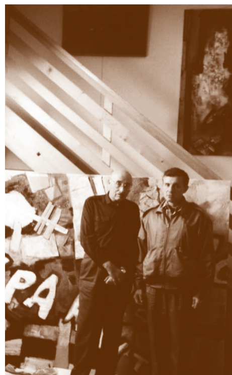
Всеволод Некрасов в мастерской Оскара Рабина в Париже. 1990-е годы