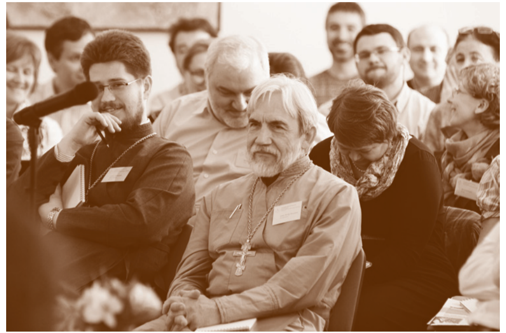
На конференции обсуждались сложные, иногда очень тяжёлые проблемы современной катехизации, но общее настроение участников тем не менее оставалось светлым и радостным

Примеры из практики катехизаторов были яркими. Оказывается, иногда дерзновенные оглашаемые подходят к священникам в храмах и просят их сказать слово на литургии после чтения Писания или хотя бы после службы.