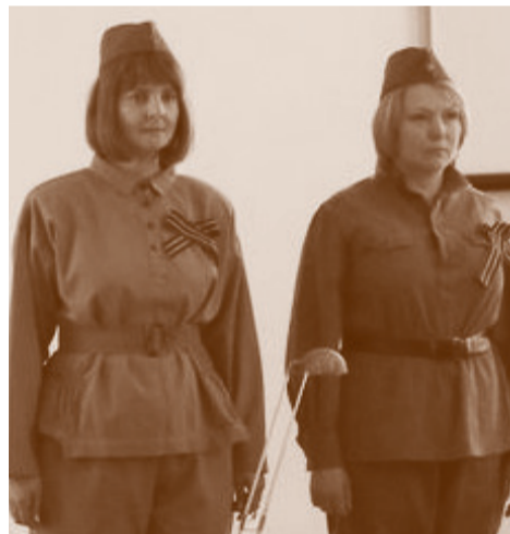
Чтение свидетельств женщин – участниц войны