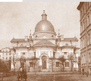
Христорождественская церковь на Песках. 1900-е гг. В 1934 году церковь была разобрана