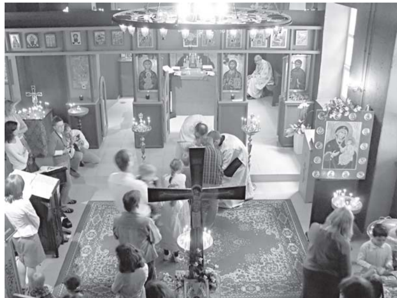
Причастие. Богослужение в храме во имя св. Григория (Перадзе)

Кстати, больше вопросов вызывает не столько сама вера, сколько жизнь по вере. Бывает, что верующего считают несовременным человеком: почему он, скажем, не