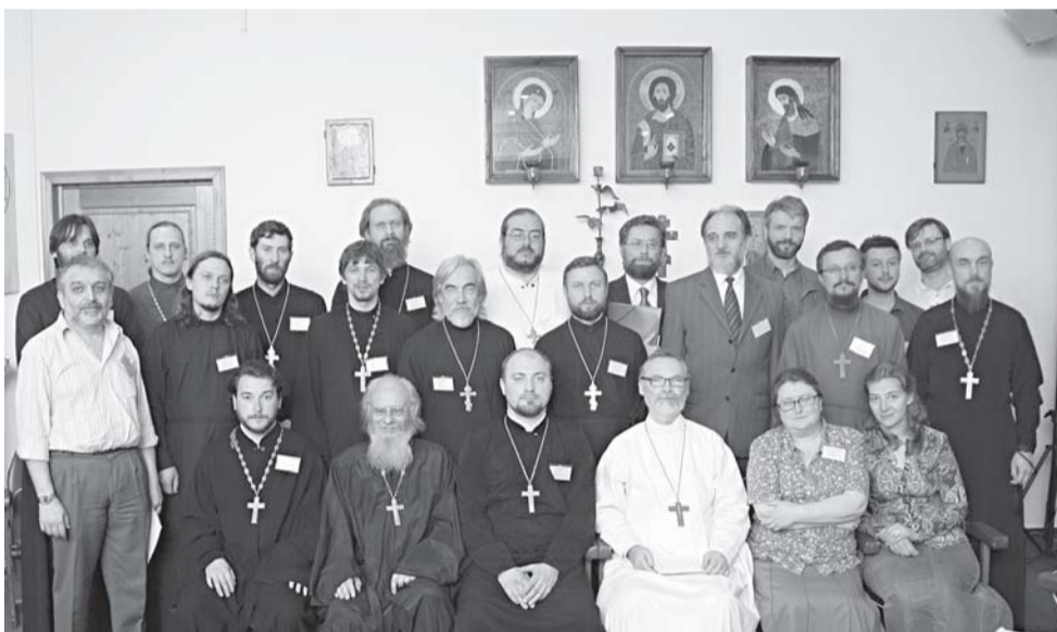
Участники конференции

Очередная, третья по счету, конференция по катехизации прошла в Свято-Филаретовском институте. В этом году она была посвящена проблемам подготовки катехизаторов