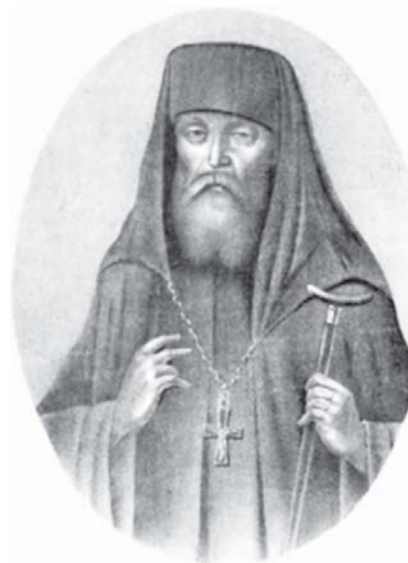
Макарий (Глухарев), архим. Литография. Ок. 1846 г.

Митрополит Филарет писал в письме к Хитровой: «Вот вам послание о. Макария. Видите, прежде нежели будет обращать