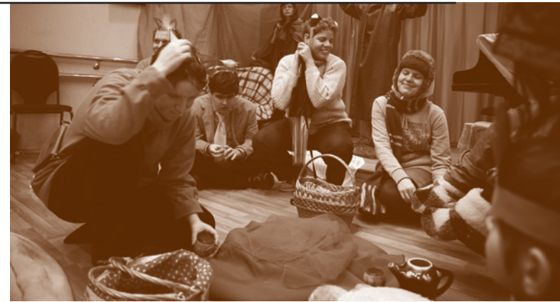
Спектакль по «Зимней сказке»

Праздник продолжился беседой о событии Рождества Христова. Часто ли мы задумываемся над тем, что холод, тьма, одиночество и зло в жизни людей связаны с отсутствием Бога, света и тепла? Рождение в мир Сына Божьего происходит в непростых условиях. Не находится человек и дом, который может принять Святое семейство. Но Рождество совершается для людей, чтобы они увидели Свет и открыли путь преодоления зла, бессмысленности и одиночества. У каждого из нас есть возможность жить во свете вопреки внешним обстоятельствам. Светлый и благодарный человек находит настоящих друзей и может делиться радостью и теплом. Так мы сидели за общим столом и рассказы-