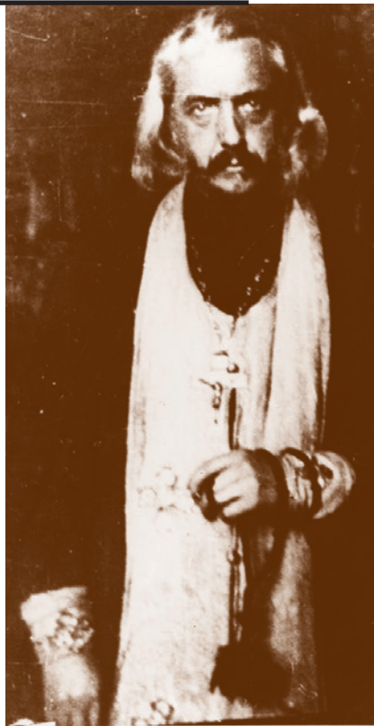
Архимандрит Серафим (Батюков)