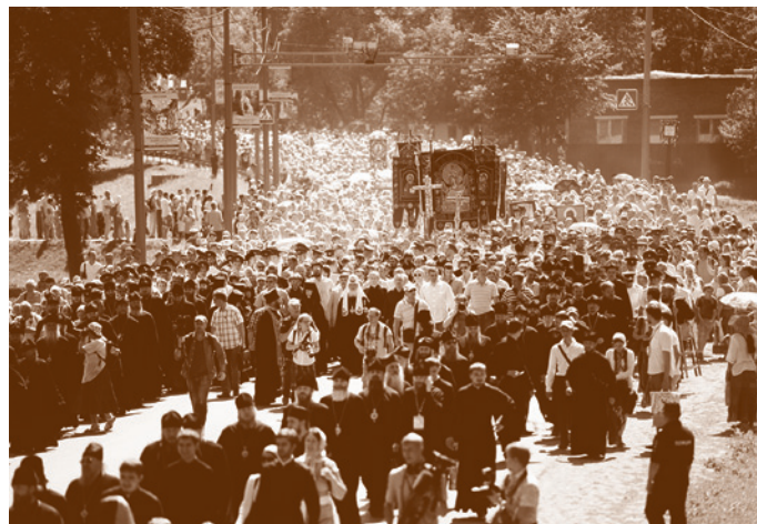
Крестный ход на 700-летие преподобного Сергия Радонежского

– Что-то надо делать еще, книжку купить и молитвы выучить. У меня сыну пятьдесят один год. В девяносто втором избили его – инвалид, болеет очень...». Режим доступа: http://olegglagolev.livejournal.com/9328.html (дата обращения: 28.12.14).