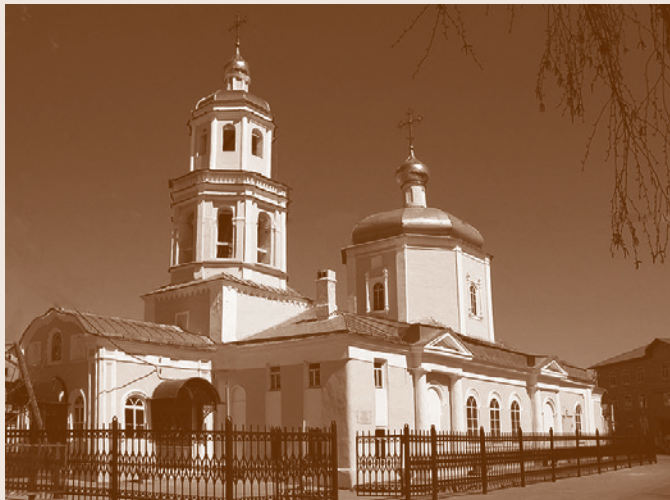
Духовный центр кряшен всей Республики Татарстан – Тихвинский храм города Казани

25 лет назад, 23 декабря 1989 года, в Казани состоялась первая Божественная литургия на кряшенском языке. С тех пор стало доброй традицией собираться кряшенским священнослужителям в день памяти святителя Иоасафа, епископа Белгородского.