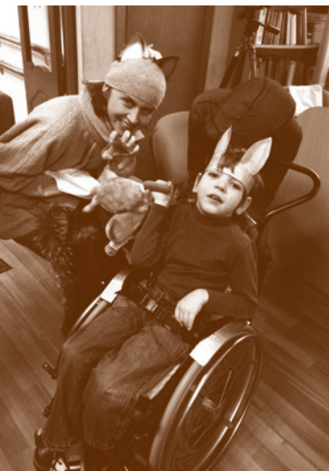
Все участники праздника прикоснулись вместе к радости Рождества