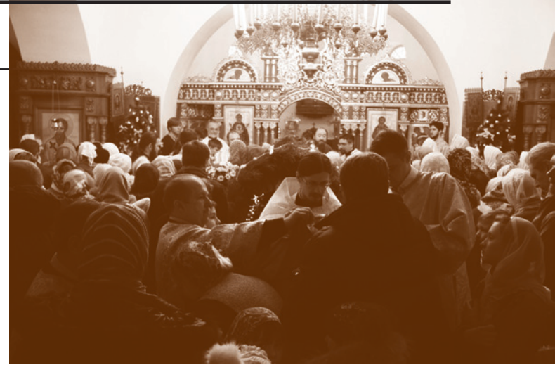
В этот день храм был полон