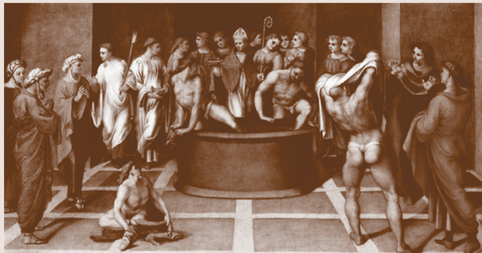
Многие сугубо музейные экспонаты, не будучи «религиозными объектами», также находятся «на стыке» музейного и церковно-исторического интереса. «Святой Августин крестит катехуменов». Джироламо Дженга. Италия, начало XVI века