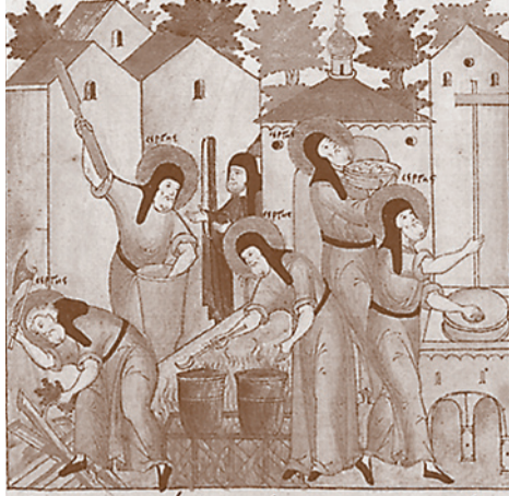
Миниатюра из «Жития Сергия Радонежского». XVI в.

ми его духовное влияние. Тем не менее справедливость требует указать, что новое аскетическое движение пробуждается одновременно в разных местах, и прп. Сергий как бы возглавляет его.