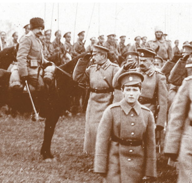
Через несколько лет этого мальчика, вместе с отцом объезжающего войска, – цесаревича Алексея, его родителей и сестёр расстреляют в подвале Ипатьевского дома в Екатеринбурге. Фотография времен Первой мировой войны

С начала войны, ставшей роковой для России, исполнилось сто лет