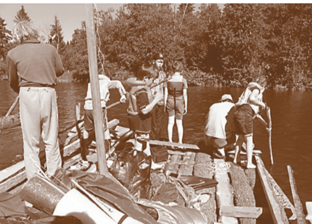
Плот получился огромный, почти корабль – шесть на три метра