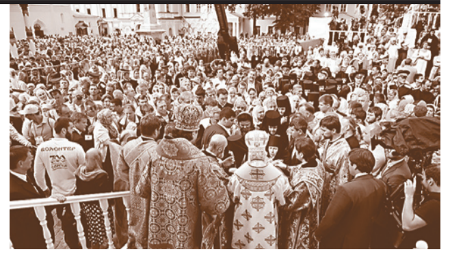
Литургия в Троице-Сергиевой лавре

Николай Ежихин: Для меня имя прп. Сергия Радонежского всю мою церковную жизнь имело большое значение. Я вырос неподалеку от Николо-Угрешского монастыря, который основал святой благоверный