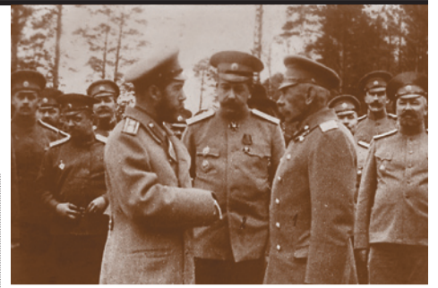
Рядом с Николаем II – генералы Н.В. Рузский и Н.Н. Янушкевич

И – как лопнули последние перенатянутые нервы! Урок Порт-Артура невоз-