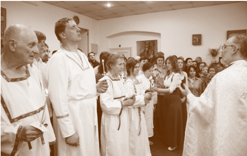
Крещение просвещаемых. Великая суббота 2014 года

Н а праздник светлого Христова Воскресения и в день памяти свв. Жён-мироносиц воцерковились больше ста человек, проходивших длительное оглашение при Преображенском братстве. Среди новопросвещённых много людей разных возрастов, профессий, образов жизни, а также национальностей: русские, украинцы, армяне, евреи, азербайджанцы, татары, грузины. Пятеро взрослых приняли таинство крещения и двое миропомазаны. На пасхальной литургии большинство из нововоцерковлённых причащались первый раз в жизни.