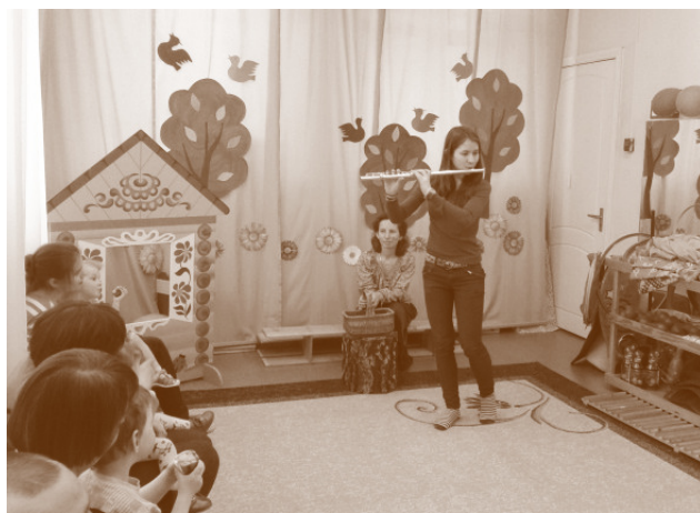
Пасхальный праздник сопровождался игрой на флейте

* Дом ребёнка № 7 – специализированный дом ребёнка для ВИЧ-инфицированных детей-сирот. Был создан в октябре 2000 года. Из-за специфики этого учреждения в материале отсутствуют фотографии детей.