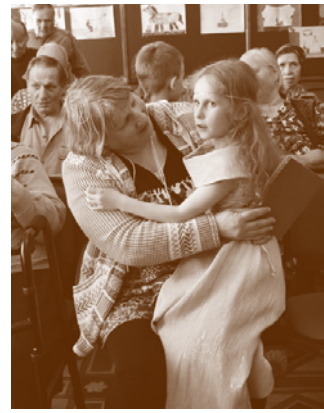
Актёры и зрители после представления

Лидия Крошкина Информационная служба Преображенского братства