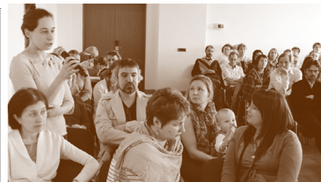
В дискуссию активно включились все участники семинара