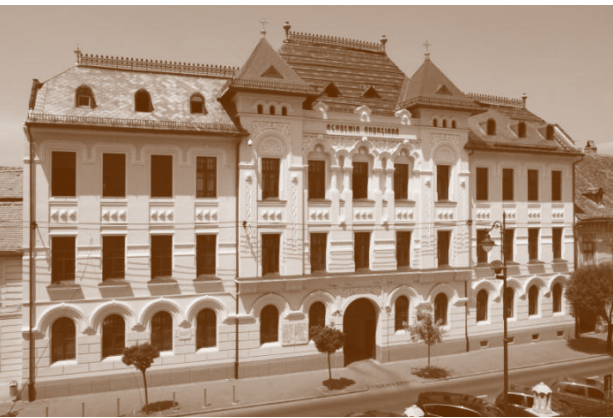
Университет имени Лучиана Благи