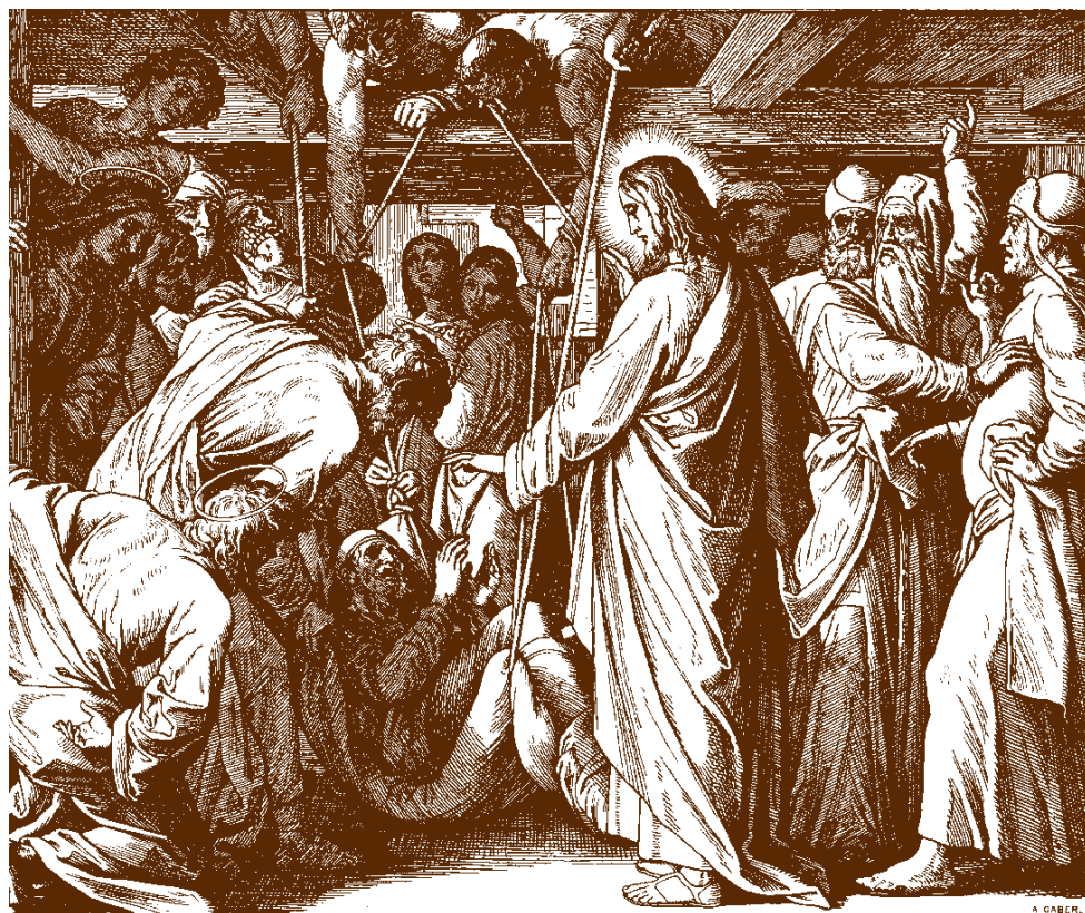
Исцеление расслабленного. Гравюра Юлиуса фон Шнорра.