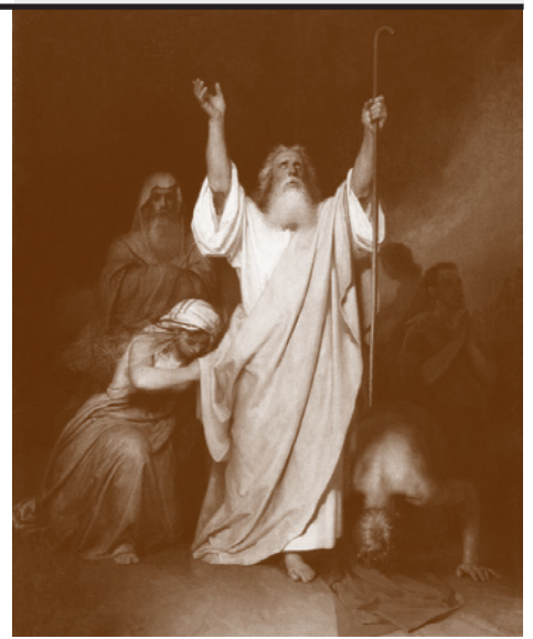
Молитва Моисея после перехода через Чермное море. И.Н. Крамской, 1861 г.

которая покрывает собою всю человеческую историю, весь мир. Я много лет интересовался философией, богословием, историей, культурой, разными религиями, но ни один автор, – за исключением, может быть, новозаветных: евангелиста Иоанна и апостола Павла, – ни один из них, мне кажется, не может быть поставлен рядом с Бердяевым. Вообще я считаю, что Николай Александрович Бердяев может быть спокойно поставлен на второе место после апостола Павла по революционности, глубине, смелости, свободе мысли, духа, жизни – всего того, о чём обычно так трудно говорить. И вот я проверял себя, – после того, как узнал эти вещи, понял, почувствовал, – я потом проверял себя по Бердяеву. При этом я по характеру человек, который не склонен соглашаться легко и просто с кем бы то ни было вообще. И я совсем, – даже при таком понимании значения Бердяева – совсем не хотел с ним соглашаться только потому, что он Бердяев. И каждый раз, читая очередную его книгу или статью – а я искал всё, что мог найти, вообще всё, – мне хотелось прочитать его, как говорится, от «а» до «я». Таких людей было несколько в моей жизни, но он, наверное, среди них стоит на первом месте.