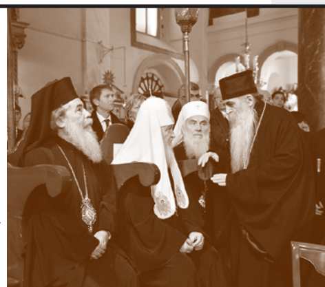
На встрече глав и представителей Поместных церквей

Он также обратил внимание собравшихся на вызовы современности, которые Собор не может обойти: «Это и массовое изгнание христиан из ближневосточного и североафриканского региона, грозящее исчезновением христианского присутствия на исконных землях первоначального распространения христианства. Это и духовная губительность культуры потребления, лежащего в основе экономического кризиса, поразившего многие страны христианского мира.