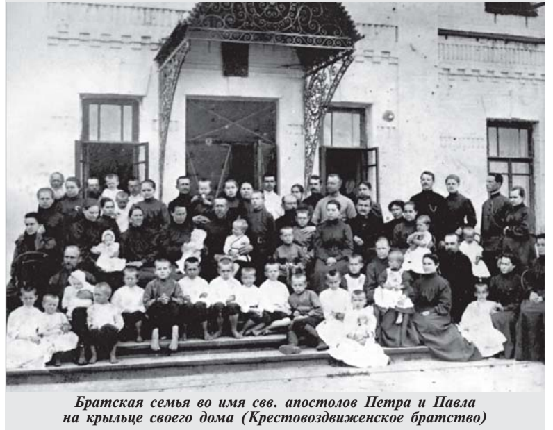
Братская семья во имя свв. апостолов Петра и Павла на крыльце своего дома (Крестовоздвиженское братство)