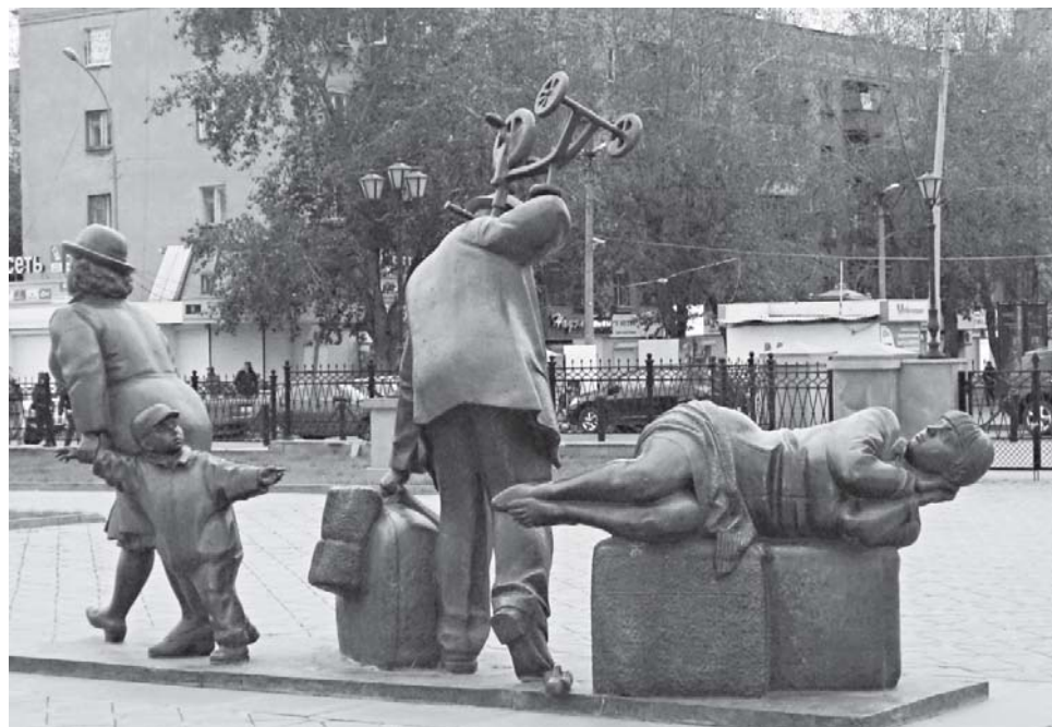
Мы очень хорошо научились чувствовать своё несовершенство... Скульптура во дворе Музея свердловской железной дороги

— Прежде всего, подумайте о том, что мы обращаемся к Богу не как к чему-то, а как к Кому-то. Бог не что, а Кто, поэтому Вы и можете иметь живые, реальные отношения с Ним. Откуда же иначе, как Вы думаете, берётся Ваша интуиция? Хорошо, если Вы поступаете по интуиции, ища воли Божьей, ища правды Его, хорошо, если Вы этой интуици-