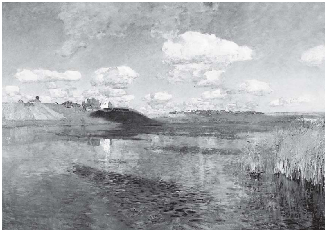
Озеро. Русь. 1899. Последняя и не вполне законченная картина И. Левитана

— Никак. Разве такое объясняется? Можно сопоставить одно с другим и сказать — «благодаря», а можно сказать — «вопреки». Но полностью выводить одно из другого вряд ли нужно. В творчестве всегда есть тайна, которая до конца ничем внешним не определяется. Во многих работах Левитана она ощущима, и это, конечно, дар Божий, а не просто выдающиеся природные или приобретенные способности. И вспоминая действительно нелегкую, даже трагическую жизнь замечательного художника (впрочем, ему многие помогали), тем более можно благодарить Бога за сам этот дар.