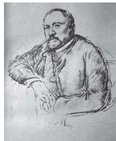
Портрет Н. Лескова работы И. Репина

— Здесь я могу только предполагать. Например, вспомнить то, что писал в одной эпиграмме (ненапечатанной) Достоевский, который творчества Лескова,