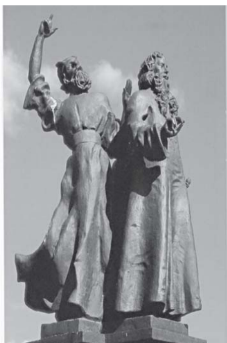
Памятник героям «Соборян» — протопопу Савелию Туберовову, отцу Захарии и дьякону Ахилле. Часть композиции памятника Н. Лескову в Орле

— Не раз приходилось слышать, как Вы в качестве катехизатора на оглашении по-