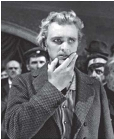
Кадр из фильма «Идиот». В роли князя Мышкина — Юрий Яковлев