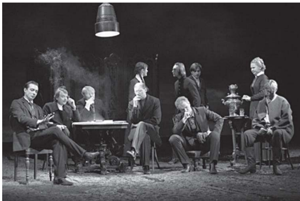
«Бесы». Спектакль московского театра «Современник» в постановке Анджелы Вайды

Достоевский обладал удивительным свойством вселенской отзывчивости. Он приписывал это свойство всему русскому народу, хотя это было, увы, не совсем правильно. Это свойство действительно есть в русском народе, но, к сожалению, в нём есть и совсем другие, иногда прямо обратные качества. И самого Достоевского тоже иногда поражал дух какой-то узости — то национальной, то исторической, то культурной. Однако он старался понять Пушкина, понять эпоху, старался понять то, что Бог говорит ему или через него современникам. Не случайно его самое глубокое целостное пророческое большое произведение — это «Легенда о великом инквизиторе», всем