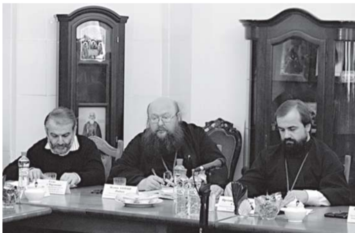
Заседание комиссии Межсоборного присутствия по вопросам организации церковной миссии