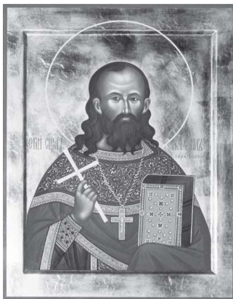
Сщмч. Михаил Саратовский. Расстрелян в 1919 г. При написании иконы была использована единственная сохранившаяся его фотография — увеличенный фрагмент фотоснимка зала суда

Интервью с секретарем Саратовской епархиальной комиссии по канонизации подвижников благочестия диаконом Максимом Плякиным