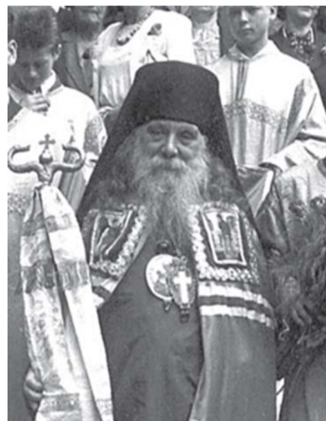
Епископ Пражский Сергий, 1941 г.

Обстановка в послевоенной России была непростой. Тяжкие лишения, атмосфера страха и доносительства, особенно усилившаяся в конце 1940-х — начале 1950-х годов в связи с кампанией по борьбе с космополитизмом и новым витком шпиономании, не обошли и Церковь, тем более что для властей люди верующие были заведомо неблагонадежными. Даже