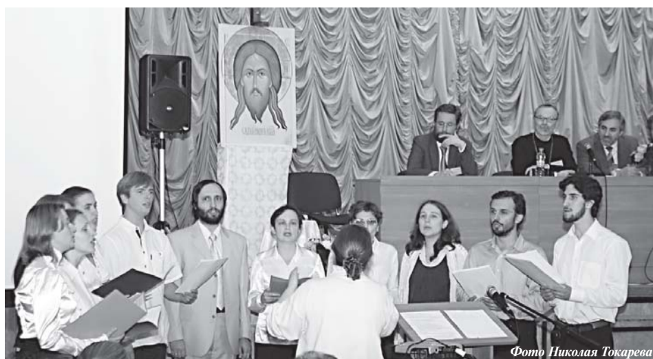
Выступление хора Преображенского братства и Свято-Филаретовского института

С любовью и благодарностью Ваша Ольга Седакова