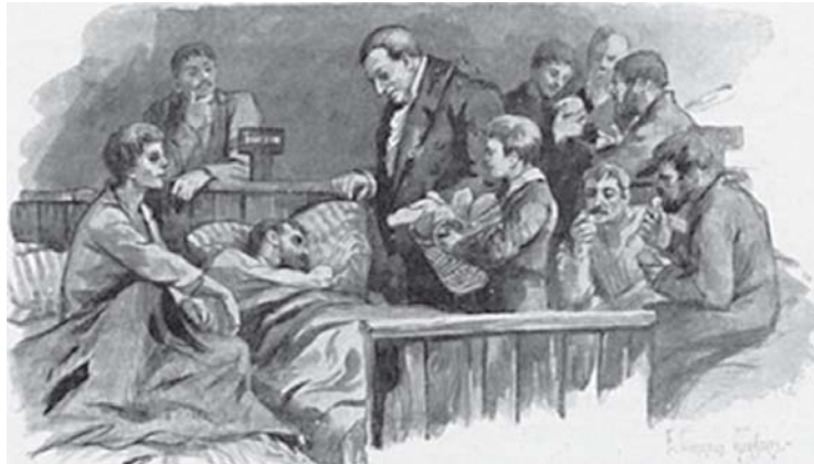
Доктор Гааз у постели больного. Самокиш-Судковская Е.П., илл. к очерку А.Ф. Кони «Федор Петрович Гааз»