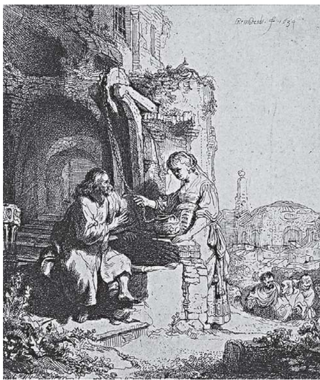
«Говорит Ему женщина Самарянка: как Ты, Иудей, просишь пить у меня, Самарянки? Ибо не имеют Иудеи общения с Самарянами» (Ин 4:9). Рембрант, 1634 г.

Не буду рассказывать истории о том, как дети (православные или неверующие) отворачиваются от неправославных христиан-родителей или родители — от неправославных христиан-детей. Школьник из баптистской или пятидесятнической семьи, признавшийся о вере своей и своих родителей, бывает гоним и одноклассниками, и учителями. Православный такого «благословения» от ближних, за