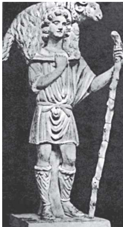
Христос — Добрый Пастырь. IV в.

Христос запретил ученикам господство над человеком: «кто хочет быть большим между вами, да будет вам слугой» (Мк 10:42-43). Апостолы заповедали: «должно повиноваться Богу больше, нежели человеку» (Деян. 5:29). «Подчиняясь друг другу, облекитесь смиренномудрием» (1Петр 5:5). Эти слова обращены к любому христианину, в том числе к епископу.