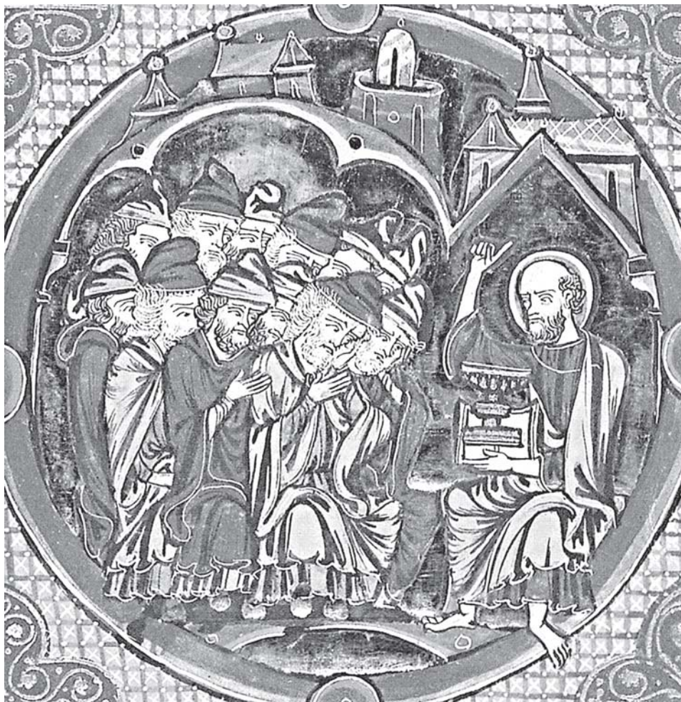
Проповедь апостола Павла. Библия св.Людвика, XIII век. Толедо (Испания).

Встреча с Богом во Христе решает и проблему одиночества, и проблему смерти: «Прохождение через смерть есть прохождение через абсолютное одиночество, через разрыв со всеми. Смерть есть разрыв со сферой бытия, прекращение всех связей и общений, абсолютное уединение. Смерть в общении, в связях с другим и с другими не была бы смертью. Смерть и значит, что больше ни с чем нет связей и