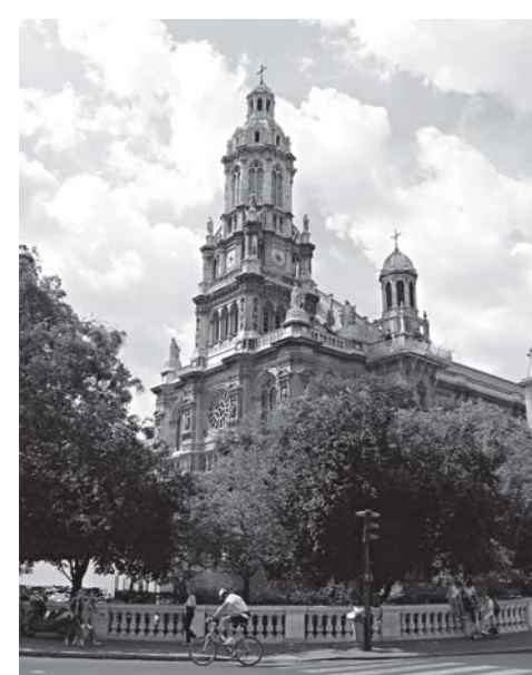
Приход La Trinité. Париж

Кардинал Люстиже очень хорошо сказал об этом на встрече в Париже: «Когда