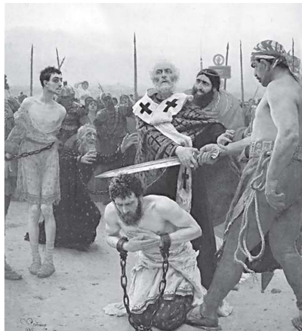
Свт. Николай Мирликийский избавляет от смерти трёх невинно осуждённых И.Е. Репин. 1888.