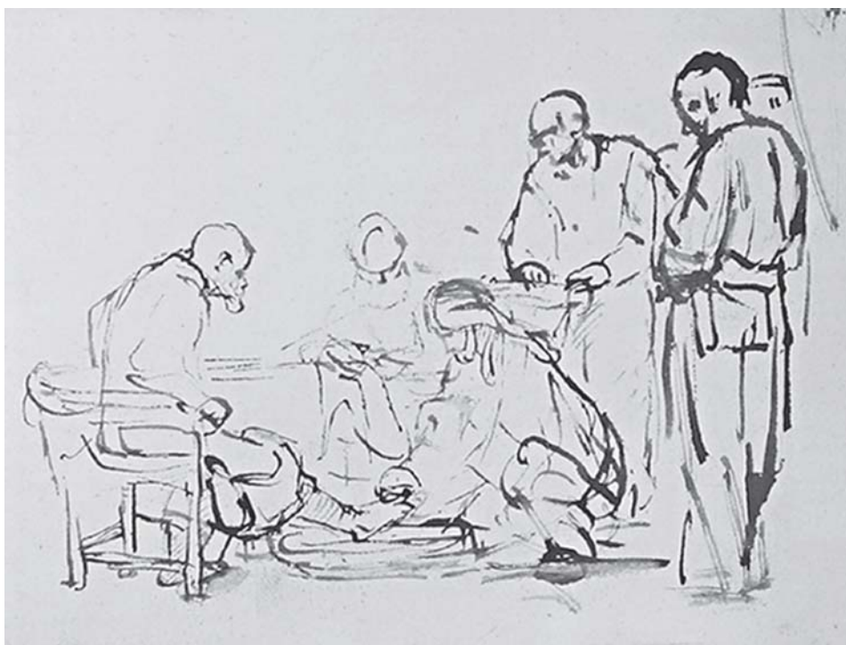
Рембрандт Харменс ван Рейн. Христос моет ноги ученикам (Ин. 13:1-17)

Итак, церковь как община возможна тогда, когда человек сделал самостоятельный шаг к Богу. Как пишет Д. Бонхёффер: «Вступает в хождение вслед каждый в одиночку, но в хождении вслед никто не остается одинок. Решившемуся в ответ на слово стать одиноким даруется общность общины. Он снова обретает себя в явном братстве, стократно возмещающем ему потерянное» 4 .