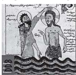
Petite boussole spirituelle pour notre temps Olivier Clément

Открытый и честный характер христианской позиции Клемана проявлялся и в его взгляде на взаимоотношения христианства и остального мира. В секуляризации со всеми ее тревожащими проблемами и последствиями он видел не «происки дьявола», а детище библейской иудеохристианской традиции, в известном смысле — исполнение слов Иисуса о разделенности Божьего и кесарева, соединение библейской борьбы с идолопоклонством и античного интеллектуализма (он называл секуляризацию «дочерью Афин и Иерусалима»). Он предупреждал христиан как против бегства от реалий современности в мироотрицающее сектанство, так и против попыток восстановления христианского присутствия в мире по старому, отжившему типу — по типу господства, авторитарной унификации под эгидой единой навязанной идеологии. Выход он видел в ином способе присутствия христианства в обществе и взаимосвязи с ним, названном им «пророческим партнерством» и понимаемом как утверждение в коммерциализированном социуме «той реальности, которая не продается и не покупается, взывая к созерцанию, а не к употреблению» и утверждая «смысл и праздник существования». Возможность такого свидетельствующего присутствия, в свою очередь, была связана для него с решением обширного круга богословских задач, ухода от «богословия повторения» и самоизоляции, от богословия, требующего