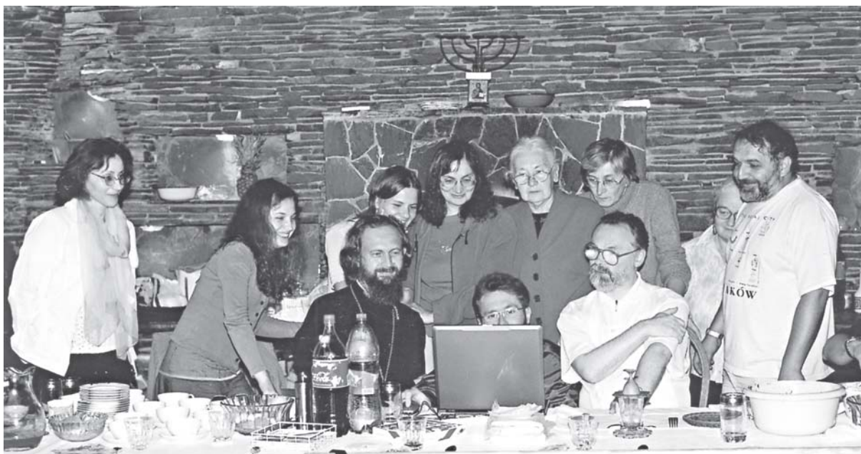
Первая община Преображенского содружества недавно отметила свое двадцатилетие