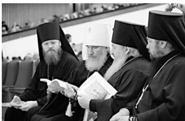
На открытии Рождественских чтений