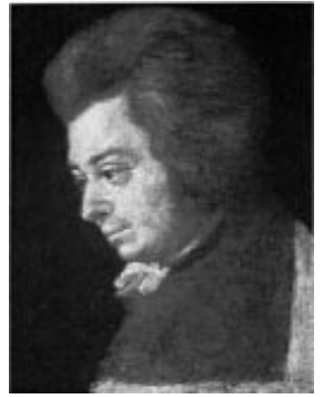
Неоконченный портрет Моцарта, играющего на фортепиано