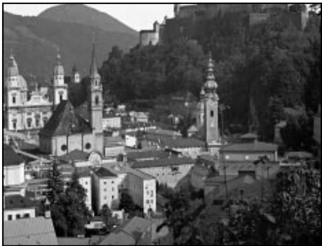
Центр Вены, каким его знал Моцарт. Собор св. Стефана, где состоялась венчание и отпевание Моцарта, виден справа за фасадом улицы