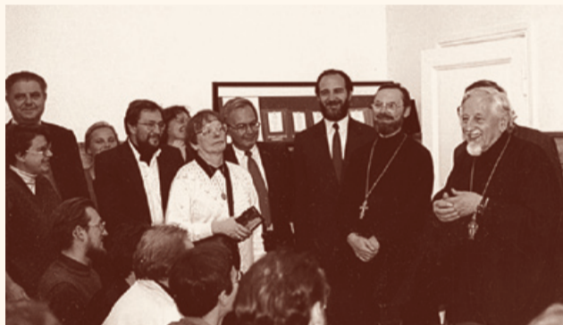
Некоторые из членов попечительского совета СФИ. 1996 г.

К 1988 году всё уже было готово. Получилось так, что именно в 1988 году, в начале февраля, родилась первая община – не огласительная группа, как вы понимаете, а община, то, к чему мы стремились с середины 1970-х годов. Всё это одно другое поддерживало. Братство ещё не было выявлено, не было оформлено. Оно существовало только потенциально. Рождение общины позволило всерьёз говорить не только о системе образования и о концепции, а иметь ту живую среду, к которой всё это могло быть естественным образом приложено. Поэтому в июле 1988 года практически вся первая община поступила в институт, который назывался тогда просто христианской школой, и больше никак. Нам ведь тогда не до куража было, нам нужно было называть всё как можно короче и проще, потому что, не забудьте, всё это было неофициально.