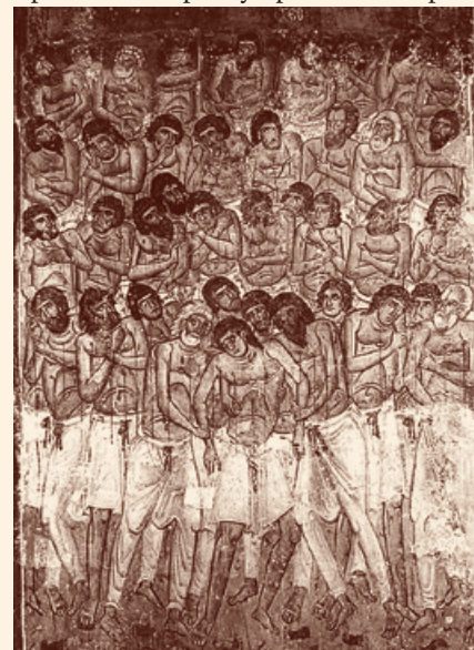
Сорок мучеников севастианских всегда были одним из самых любимых в церкви образов друзей, вместе принявших мучения и смерть за веру во Христа

Иногда только лишь присутствие верующих друзей или пресвитеров вдохновляло и укрепляло христиан на проповедь родным. В житии мчч. Спевсиппа, Елевсиппа, Мелевсиппа, бабки их Леониллы и с ними Неона, Турвона и Иовиллы (16/29 января) мы встречаемся именно с такими примерами. Началась эта история с того, что епископ Смирнский Поликарп (ученик Иоанна Богослова) послал двух священников и дьякона в Галлию (ныне – Франция), потому что там начались гонения на христиан. В Галлии их принял в свой дом гостеприимный сенатор Фавст. «Когда он узнал, что гости – пресвитеры, то стал усердно просить их, чтобы они привели ко Христу чрез святое креще-