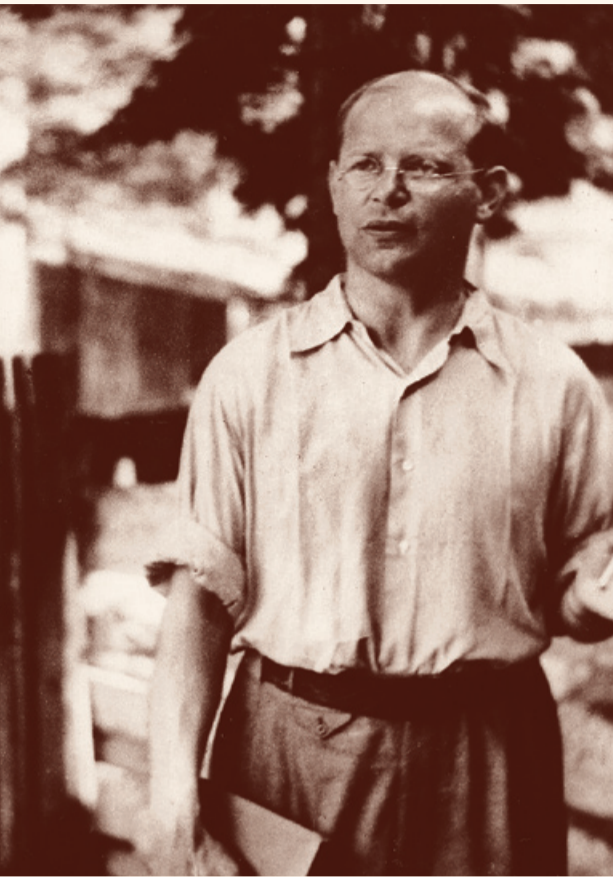
Д. Бонхёффер во дворе тюрьмы Тегел. 1944 г.

И когда друг откликается – тогда, значит, я жива, мы живы».