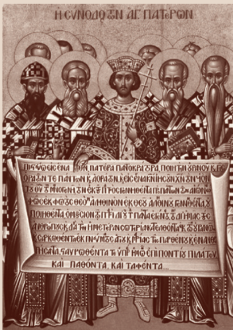
Отцы Первого Вселенского собора с императором Константином, держащие Символ веры

Наша португальская реальность такова, что взрослых почти не крестим (1–2 человека в год). Взрослые все давно крещены, ведь на Украине и в Молдове некрещёных почти нет, а верные у нас в основном как раз из этих стран. Они порой годами живут в Португалии, не желая знать, есть ли в стране православные общины. Смутное религиозное чувство пробуждается у таковых лишь при рождении ребёнка («плохо спит», «пысается», «сосочку выплёвывает», «не лететь же в отпуск с некрещённым» etc.). Находят номер телефона, звонят: «А когда можно приехать ребёнка окрестить?» Вот эти-то крещёные, да не просвещённые родители – объект нашей приходской катехизации. Да ещё их знакомые и/или родня, которые хотят быть крёстными младенцев. Предлагаем им прийти на первую беседу. «Ой, а нельзя сразу договориться о дате крещения? Мы вот уже наметили... Как это нельзя? Бабушка уже билет купила, чтобы прилететь на крещение, ресторан уже заказан! Будем жаловаться вашему начальству!» Начинаешь убеждать и уговаривать. Затем, уже на первой беседе, нервно поглядывают на часы и через каждые 10 минут раздражённо спрашивают: а крестить когда будете? И когда им говоришь, что ещё не скоро, нужно прослушать серию бесед, а также подготовиться к исповеди, к причащению, вообще начать активно участвовать в церковной жизни, то это многих очень сильно раздражает. У вас в СФИ