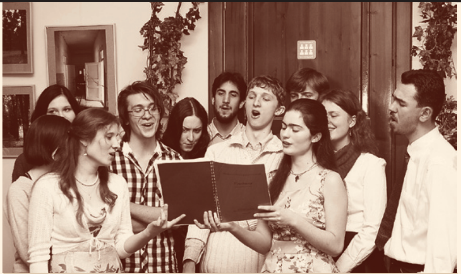
Члены молодёжного «Круга» исполняют рождественские песнопения во время праздника, который они ежегодно проводят для своих нецерковных друзей. Рождество 2012 года

После таких примеров становится понятно, что ни возраст, ни немощи, ни гонения не могут помешать нашему свидетельству, особенно если мы помогаем в этом друг другу. Как нам познакомить наших верующих и неверующих друзей и родственников? Сейчас это делается очень просто и естественно. Например, вы шли мимо, купили торт и зашли чаю попить к своим верующим друзьям. А там – родственники неверующие, с которыми можно познакомиться и пообщаться. Можно услышать возражение, что для таких чаепитий сейчас нет времени, что все загружены делами, что и так приходится разрываться