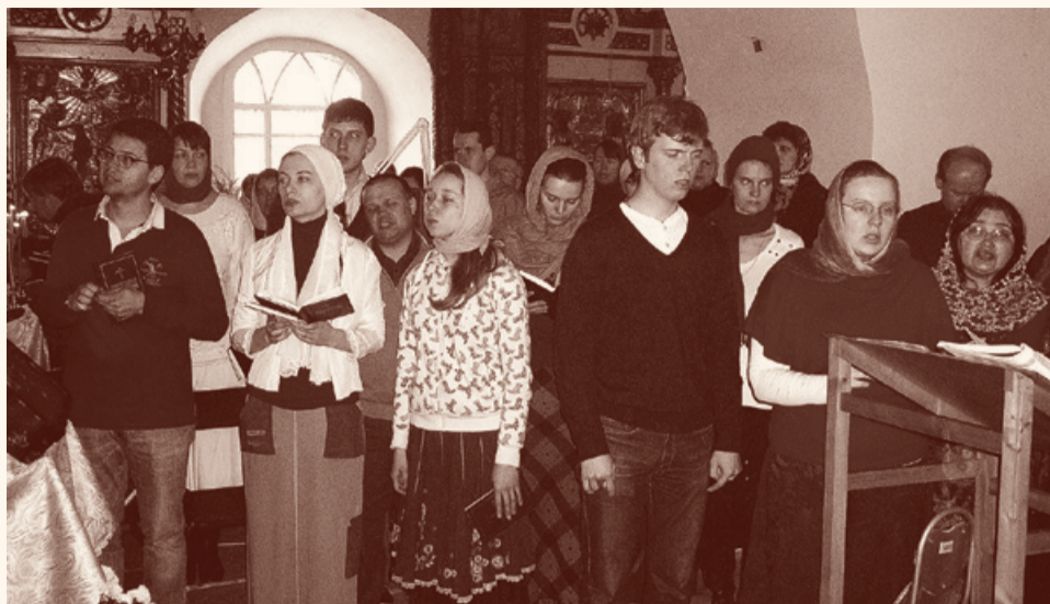
Новоцерковленные на пасхальном богослужении. Свято-Сретенский храм с. Заостровье, 2011 г.

Только задумайтесь, евреям пришлось сорок лет странствовать по пустыне, пока не умерло поколение с рабским менталитетом. Только им случилось небольшое искушение, и они тут же начинали причитать: «Лучше бы нам вернуться в Египет, где у нас были котлы с мясом. Даже если бы мы были рабами, мы были сыты». И они не могли войти в землю обетованную до тех пор, пока не умерло это поколение. Сорок лет понадобилось для того, чтобы пройти путь, который мог занять бы две недели. Думаю, и у нас должно пройти немало лет, чтобы положение вещей как-то изменилось. Дело в том, что желание есть, но не хватает мужества. На мой взгляд, нашим священникам надо быть мужественнее. Я попробовал проявить это мужество, но в итоге оказался на берегу океана.