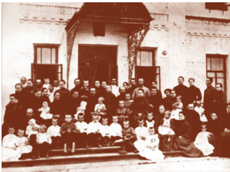
Братская семья во имя свв. апостолов Петра и Павла на крыльце своего дома (Крестовоздвиженское братство)

С егодня большое значение в РПЦ придается возрождению таких церковных служений, как миссия и катехизация, которые сейчас далеки от того состояния, в котором их хотелось бы видеть. Об этом свидетельствуют выработанные официальные документы РПЦ, например, «Концепция миссионерской деятельности», «Концепция возрождения миссионерской деятельности Русской Православной Церкви» и принятые Архиерейским собором решения об обязательной катехизации (оглашении) перед крещением – не менее трех огласительных бесед. Новый типовой приходской устав предусматривает введение штатной должности катехизатора на каждом крупном приходе. В Барнаульской епархии, как вы знаете, недавно даже создана специальная школа для подготовки катехизаторов при БДС. Эти радостные явления вселяют определенную надежду на возрождение церковной жизни и церковных служений. Но часто как о миссии, так и о катехизации говорят