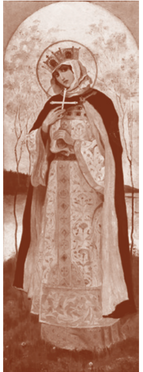
Св. равноап. княгиня Ольга. М.В. Нестеров. Фрагмент росписи Владимирского собора в Киеве

Новый закон о языке пока еще только вступает в силу. Обсуждение законопроекта о языке в Верховной Раде прохо-