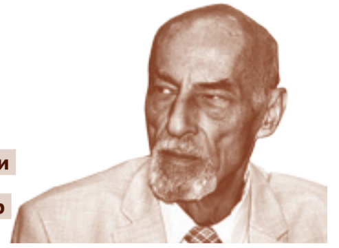
6 июня на 73-м году жизни скончался известный искусствовед и архитектор Вячеслав Глазычев