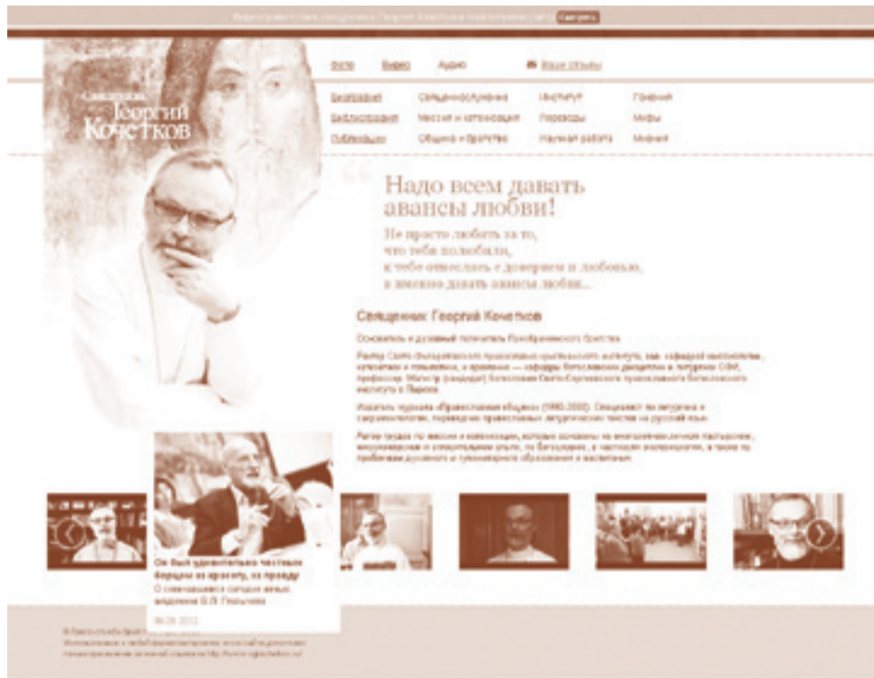
первая страница сайта www.ogkochetkov.ru